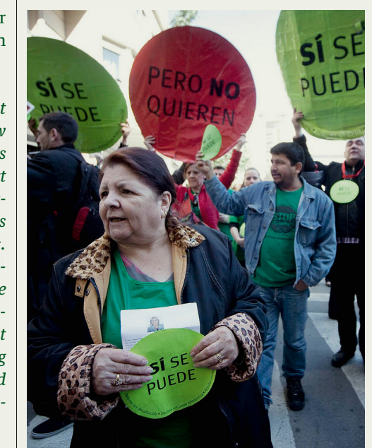
Protestaktion der spanischen Artistengruppe Enmedio