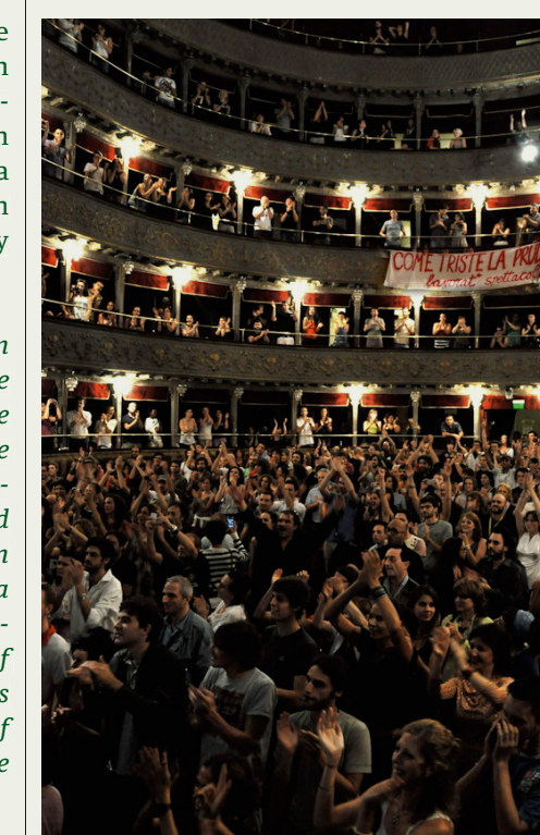
Oben: Teatro Valle Occupato