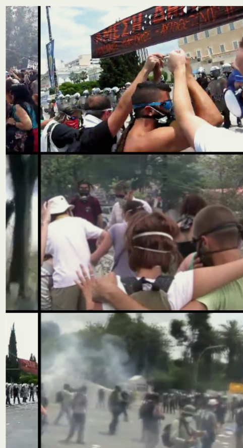
Proteste auf dem Athener Syntagma-Platz