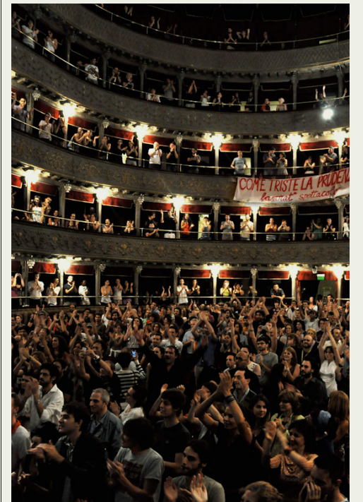
Teatro Valle Occupato