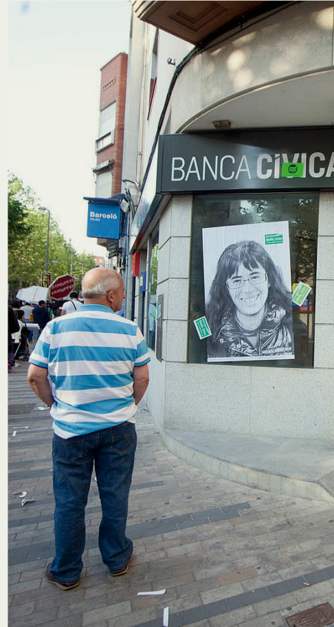
Protestaktion der spanischen Artistengruppe Enmedio