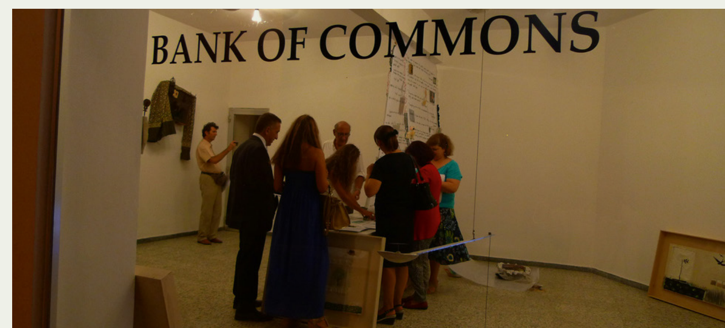
links: BANK OF COMMONS unten: Aktionen der griechischen »Kartoffelbewegung«