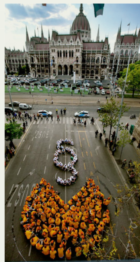
Proteste in Budapest