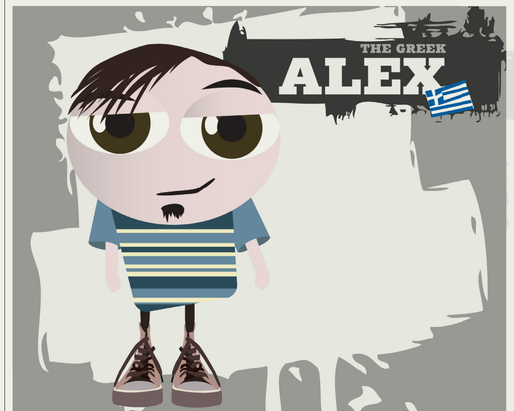
Videoclip ALEX des griechischen Medienkollektivs Omikron