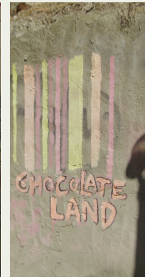
Eindrücke aus Griechenland von Despina Grammatikopulu