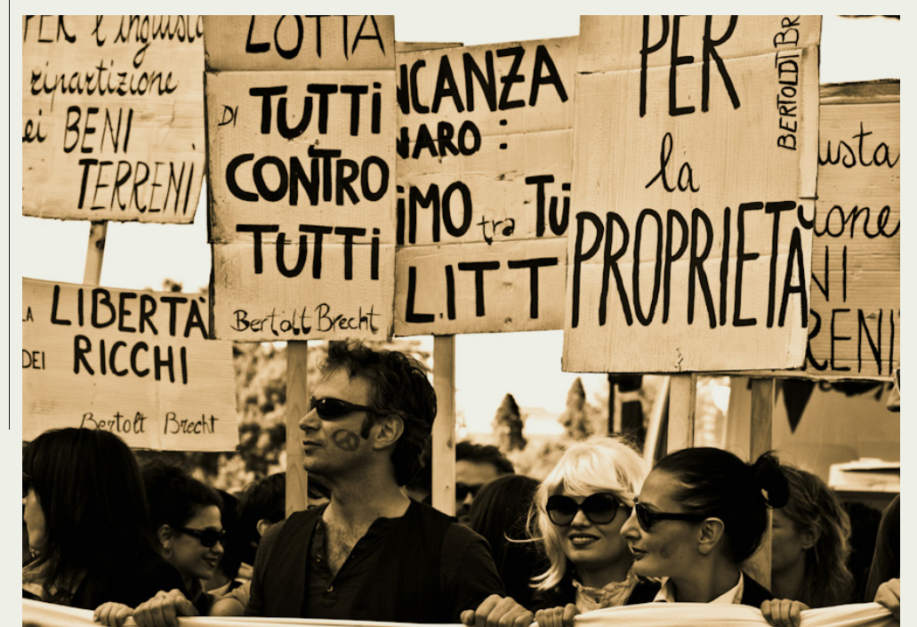
Teatro Valle Occupato

in Italian culture. They have issued an appeal signed by over 8,000 persons for transforming the Teatro Valle in a foundation of commons. Teatro Valle Occupato became an internationally known symbol for public assemblies, self-education processes, and multidisciplinary and democratic approaches by giving space for elaborating political and critical thoughts in a collaborative and active way. Teatro Valle Occupato organizes theatrical events, workshops, residencies, and an emerging worldwide network.