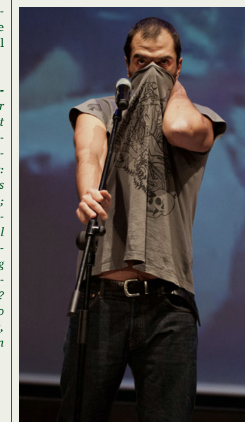
TELEMACHOS - SHOULD I STAY OR SHOULD I GO?

The Greek directors Anestis Azas and Prodromos Tsinikoris have been working together since 2011. Their experiences as assistants at Rimini Protokoll influenced them to start developing their own documentary theater performances in connection with the crisis in Greece: BAHNREISE (TRAIN TRIP) about the cutbacks in the train system in Greece (Athens, 2011); EPIDAUROS - EINE DOKUMENTATION (EPIDAUROS - A DOCUMENTATION), a critical review of the Epidaurus Festival and its meaning for the local community since the beginning of the 1950s (Epidaurus, 2012); and TELEMACHOS - SHOULD I STAY OR SHOULD I GO? (Berlin and Athens, 2013), which was invited to Heidelberger Stückmarkt and to Premieres, the European festival for young directors in Karlsruhe.