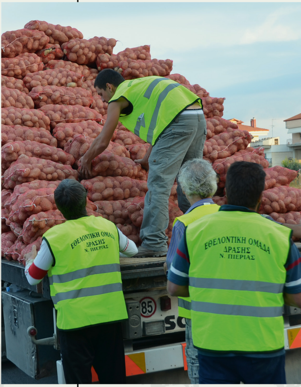
Aktion der griechischen »Kartoffelbewegung«