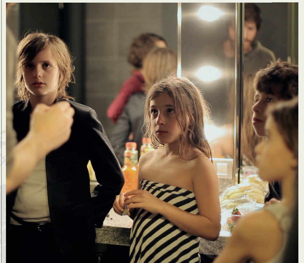
LOS PRIMEROS DÍAS, Film von La tristura